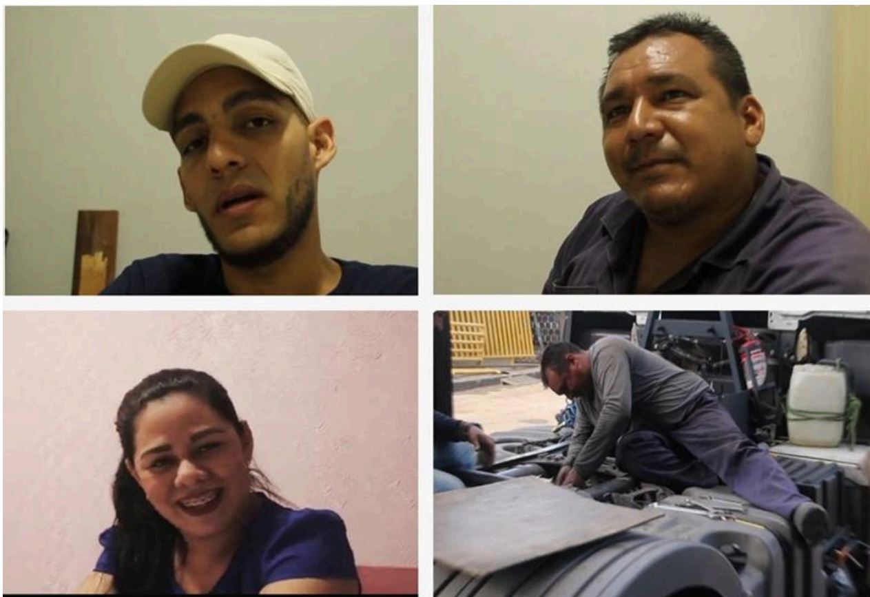
Figura 2 – Prints das videoentrevistas com os sujeitos-personagens

escuta qualificada e de expressão discursiva. Através da participação ativa nas etapas de construção narrativa e estética do documentário, os sujeitos-personagens experienciaram práticas de valorização de seus saberes e trajetórias de vida, o que contribuiu para o reforço de vínculos identitários e sociocomunitários no contexto da investigação, conforme demonstrado na Figura 2.