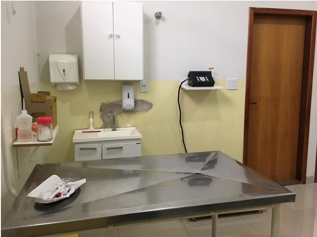
Figura 7 – Internação da Clínica Veterinária Casa dos Animais, local onde é realizado o Estágio Curricular Supervisionado, com início no dia 24 de agosto de 2020.