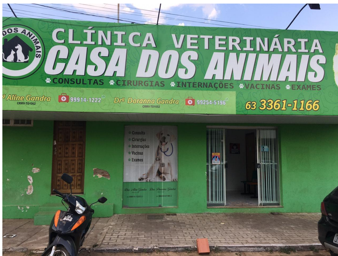
Figura 2 – Recepção da Clínica Veterinária Casa dos Animais, local onde é realizado o Estágio Curricular Supervisionado, com início no dia 24 de agosto de 2020.

Figura 1 – Fachada da Clínica Veterinária Casa dos Animais, local onde é realizado o Estágio Curricular Supervisionado, com início no dia 24 de agosto de 2020.