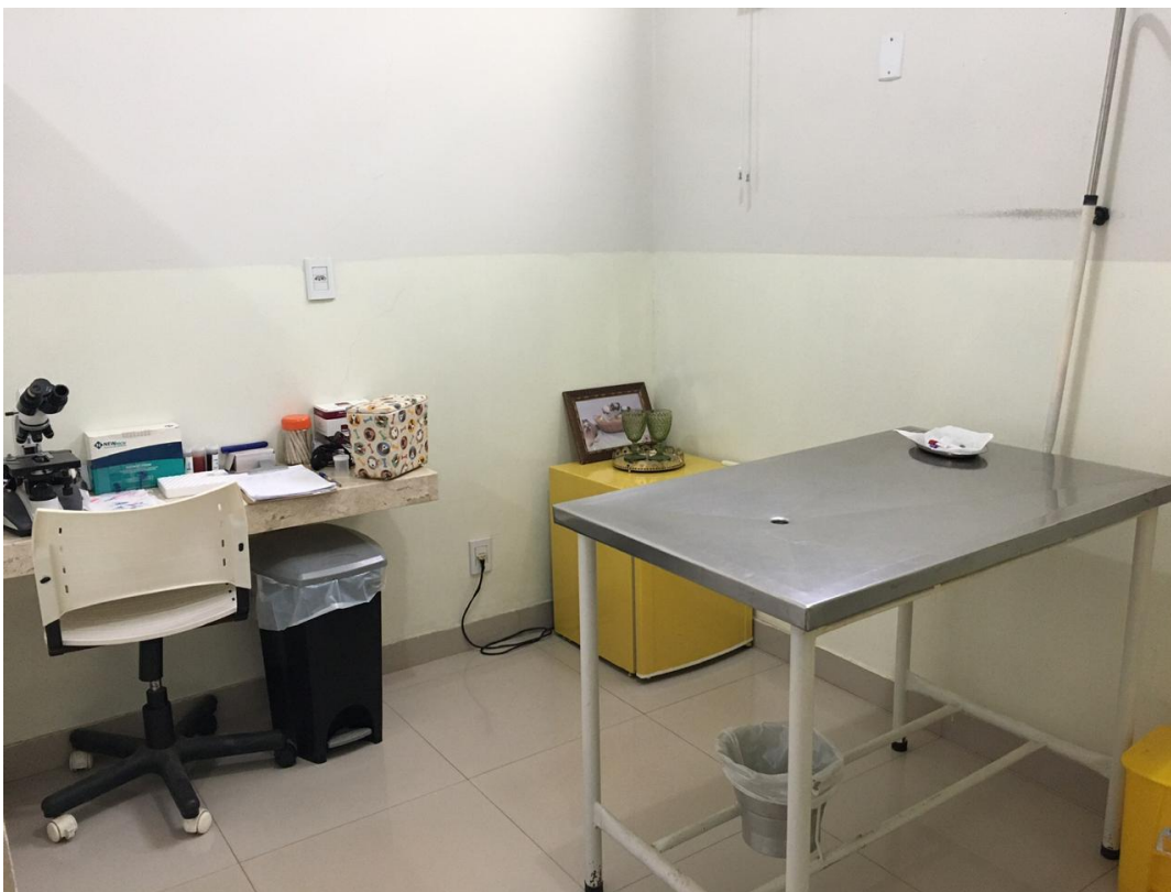
Figura 6 – Consultório da Clínica Veterinária Casa dos Animais, local onde é realizado o Estágio Curricular Supervisionado, com início no dia 24 de agosto de 2020.