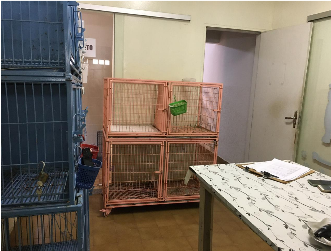
Figura 9 – Isolamento de doenças infectocontagiosas da Clínica Veterinária Casa dos Animais, local onde é realizado o Estágio Curricular Supervisionado, com início no dia 24 de agosto de 2020.