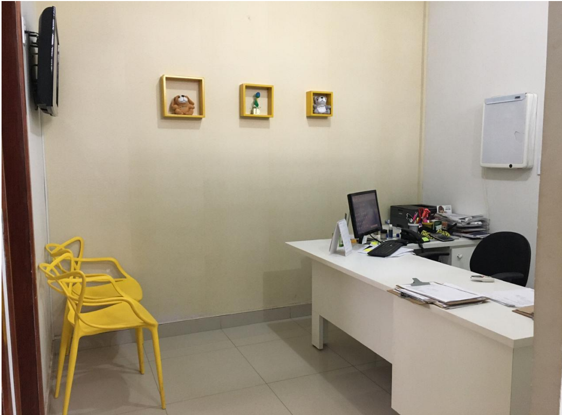
Figura 5 – Consultório da Clínica Veterinária Casa dos Animais, local onde é realizado o Estágio Curricular Supervisionado, com início no dia 24 de agosto de 2020.