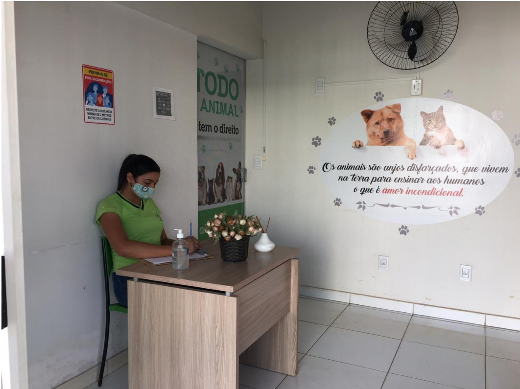
Figura 3 – Recepção da Clínica Veterinária Casa dos Animais, local onde é realizado o Estágio Curricular Supervisionado, com início no dia 24 de agosto de 2020.