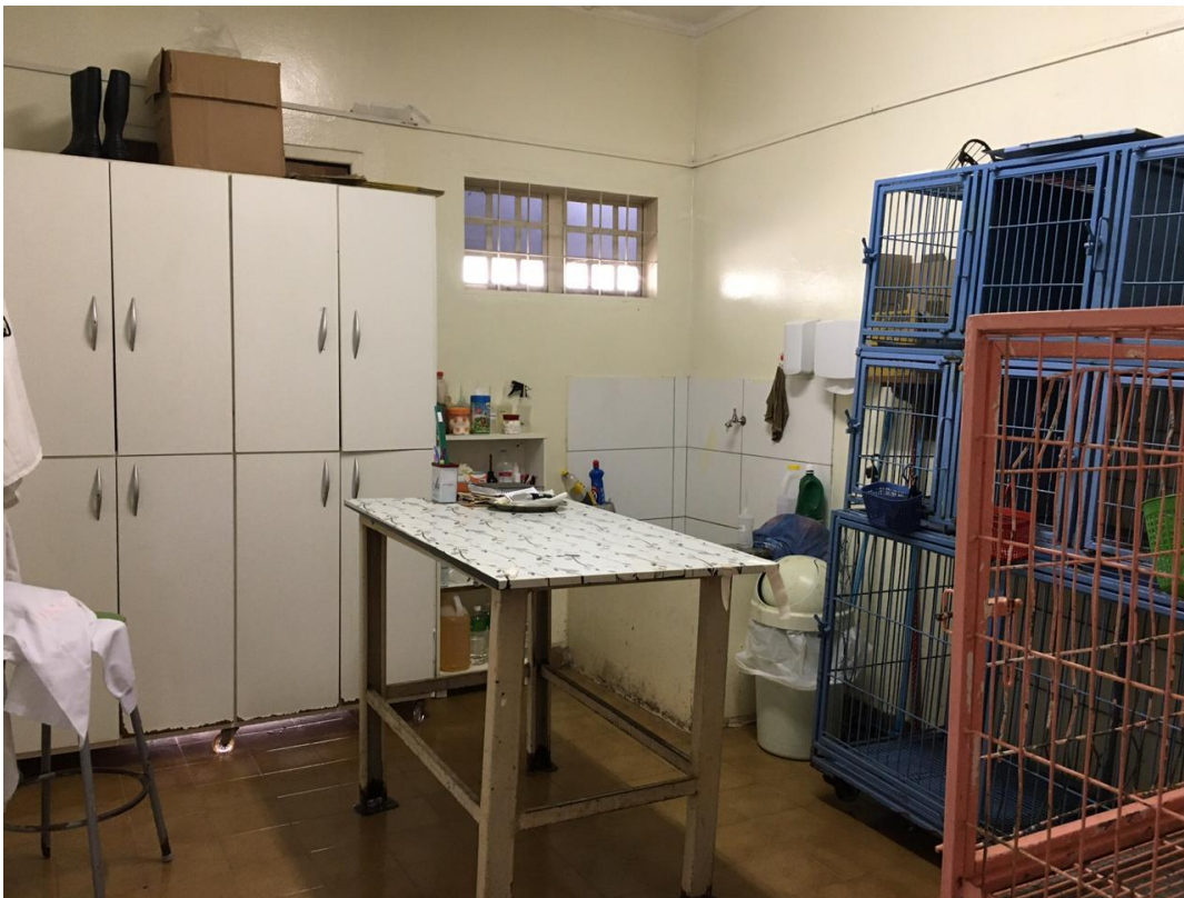
Figura 8 – Internação da Clínica Veterinária Casa dos Animais, local onde é realizado o Estágio Curricular Supervisionado, com início no dia 24 de agosto de 2020.