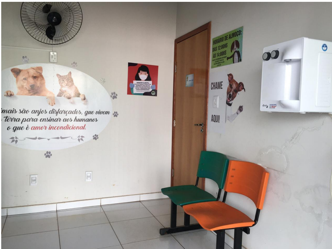
Figura 4 – Consultório da Clínica Veterinária Casa dos Animais, local onde é realizado o Estágio Curricular Supervisionado, com início no dia 24 de agosto de 2020.