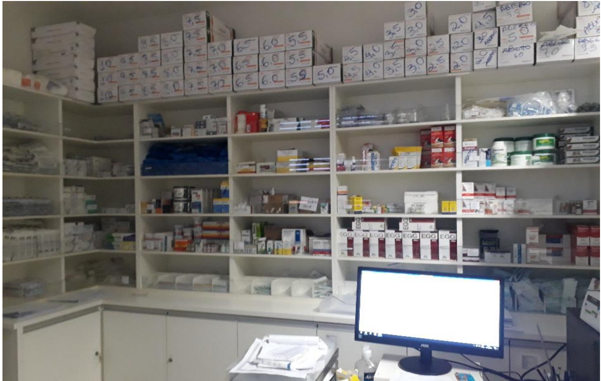
Figura 28. Farmácia do Hospital Veterinário – CEULP/ULBRA.