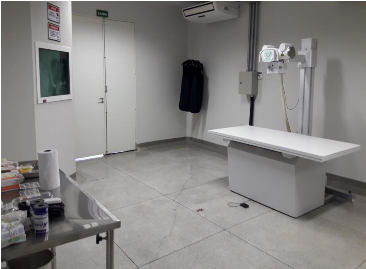
Figura 25. Sala de Raio-X do Hospital Veterinário – CEULP/ULBRA.