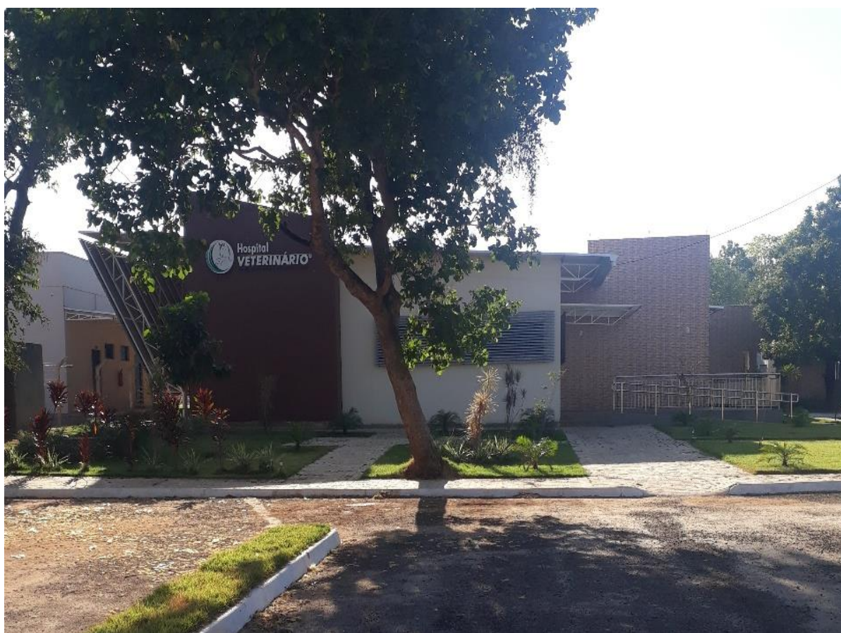
Figura 18. Fachada do Hospital Veterinário - CEULP/ULBRA.

A preceptoria (Figura 17) funciona em forma de rodízio diário entre os professores das disciplinas referentes à clínica e à cirurgia que compõem o corpo docente do curso de medicina veterinária da Instituição e todos os veterinários contratados que atuam somente no hospital.