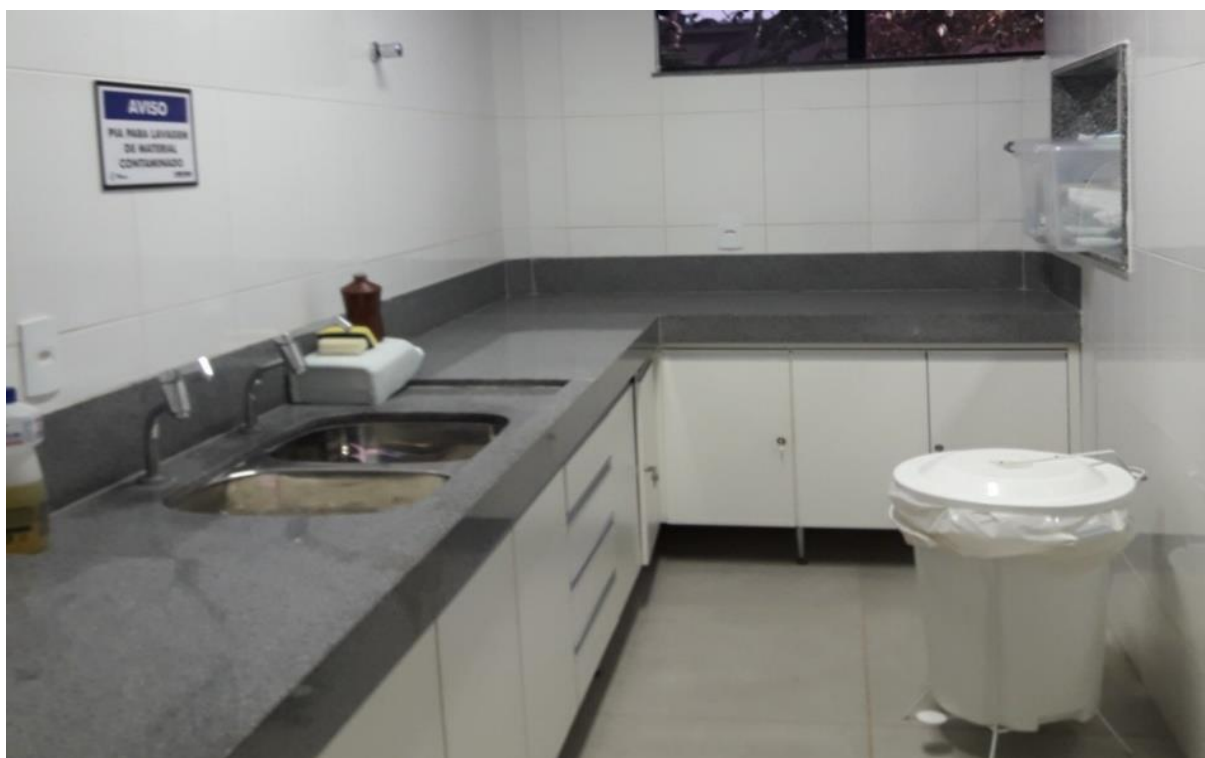
Figura 32. Sala de Esterilização Suja do Hospital Veterinário – CEULP/ULBRA.