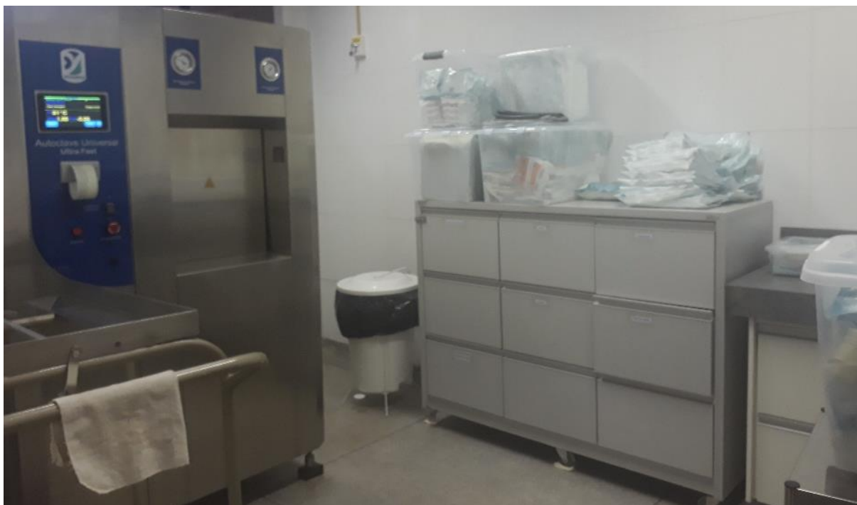
Figura 31. Sala de Esterilização Limpa do Hospital Veterinário – CEULP/ULBRA.