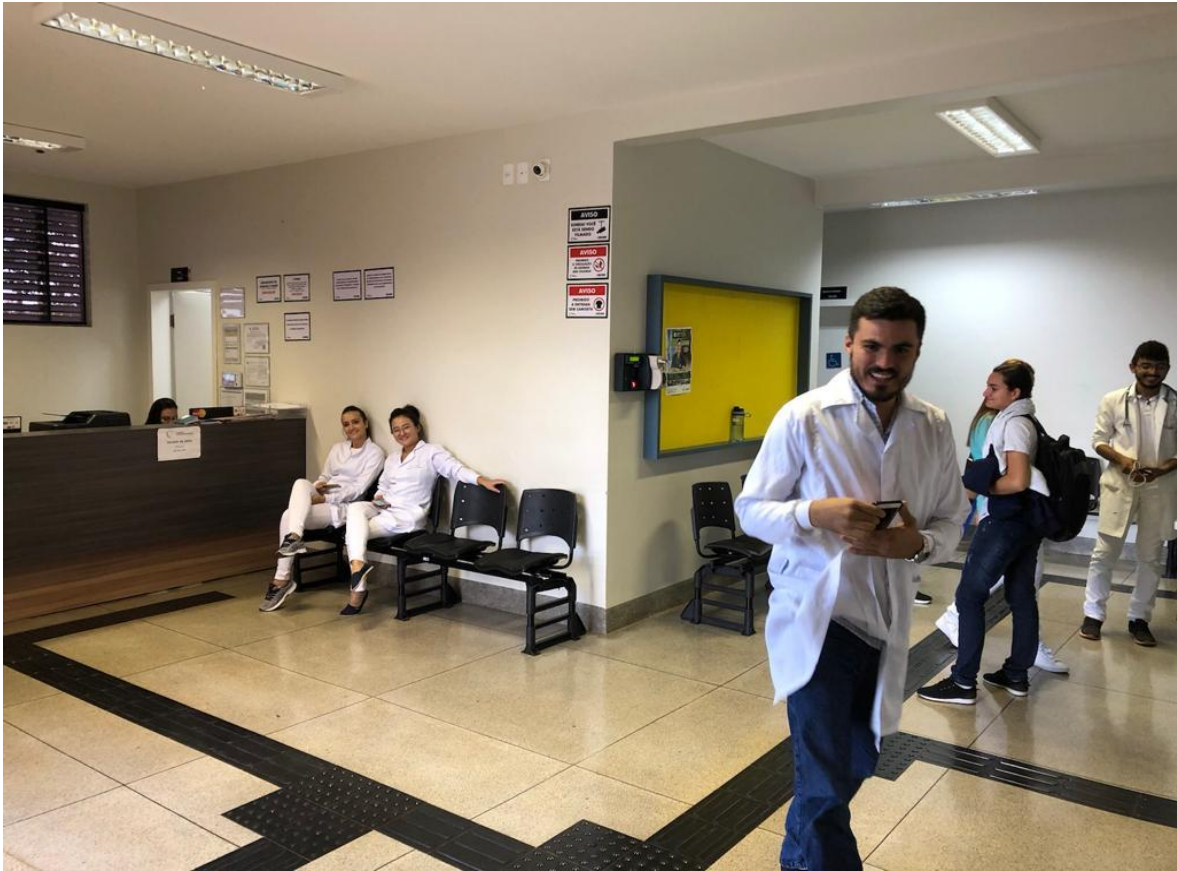
Figura 19. Recepção do Hospital Veterinário - CEULP/ULBRA.