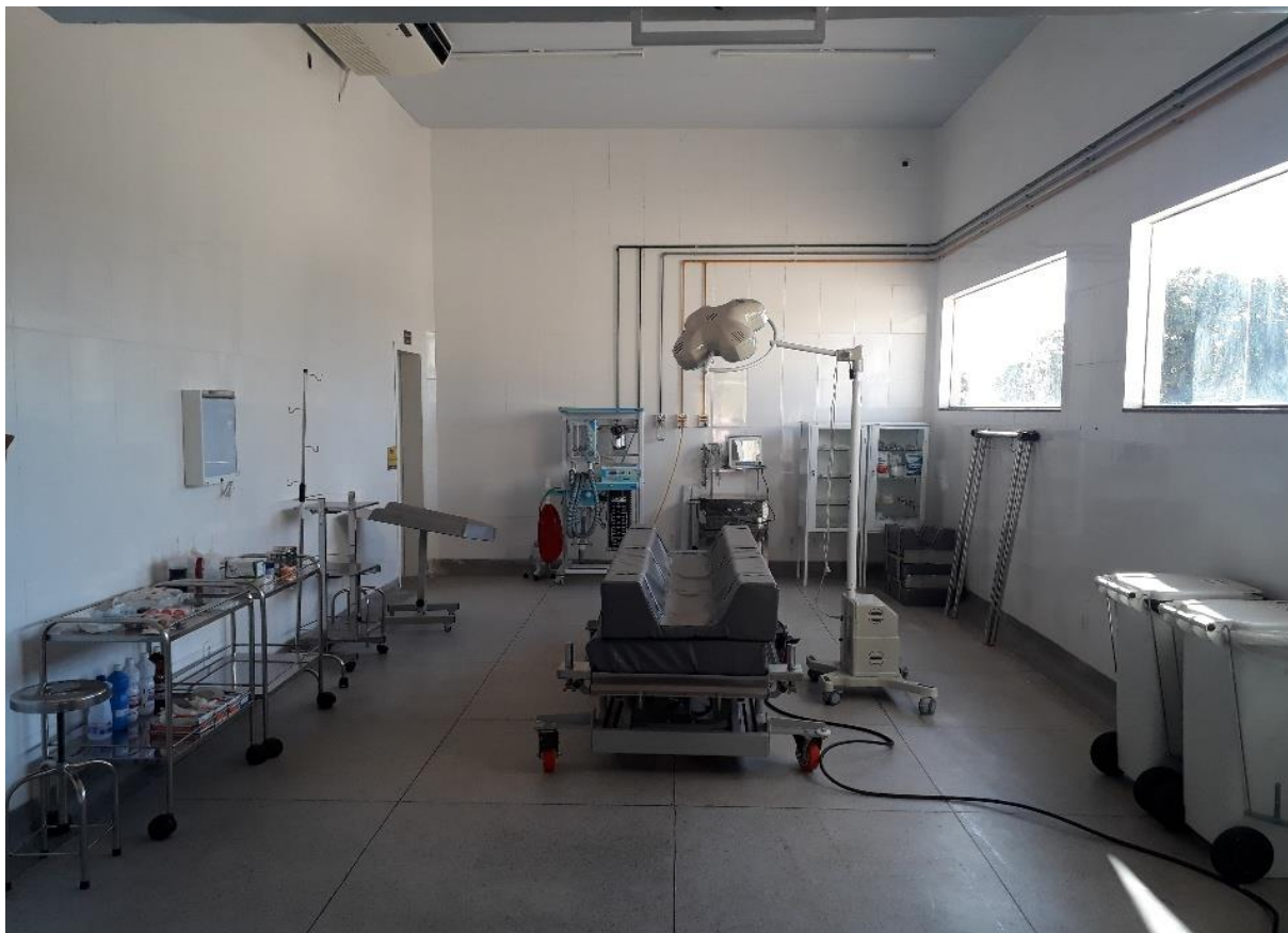
Figura 33. Centro Cirúrgico de Grandes do Hospital Veterinário – CEULP/ULBRA.