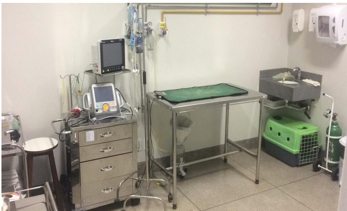
Figura 24. Ambulatório do Hospital Veterinário – CEULP/ULBRA