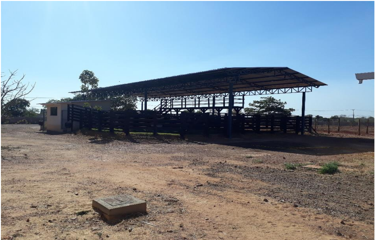
Figura 22. Curral do Hospital Veterinário – CEULP/ULBRA.