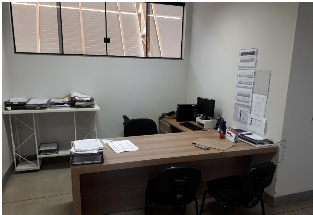
Figura 34. Sala de Preceptoria do Hospital Veterinário – CEULP/ULBRA.