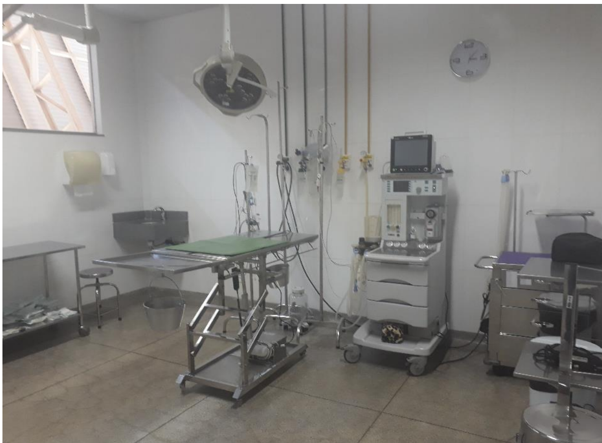
Figura 29. Centro Cirúrgico I do Hospital Veterinário – CEULP/ULBRA.