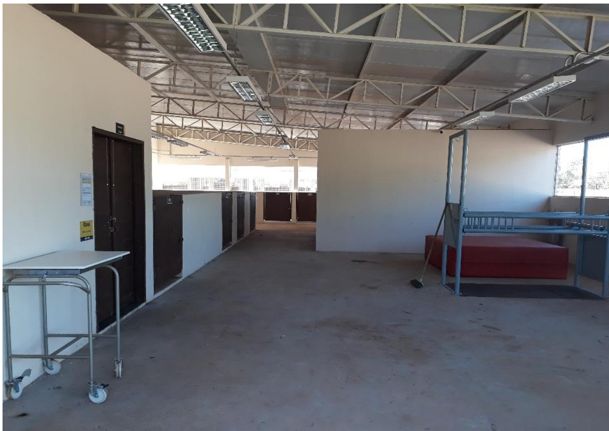
Figura 23. Área de Manejo de Animais de Produção do Hospital Veterinário – CEULP/ULBRA.