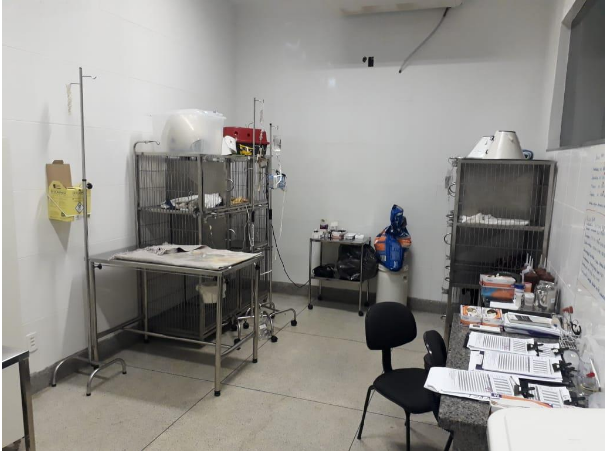
Figura 27. Sala de Internação Canil do Hospital Veterinário – CEULP/ULBRA.