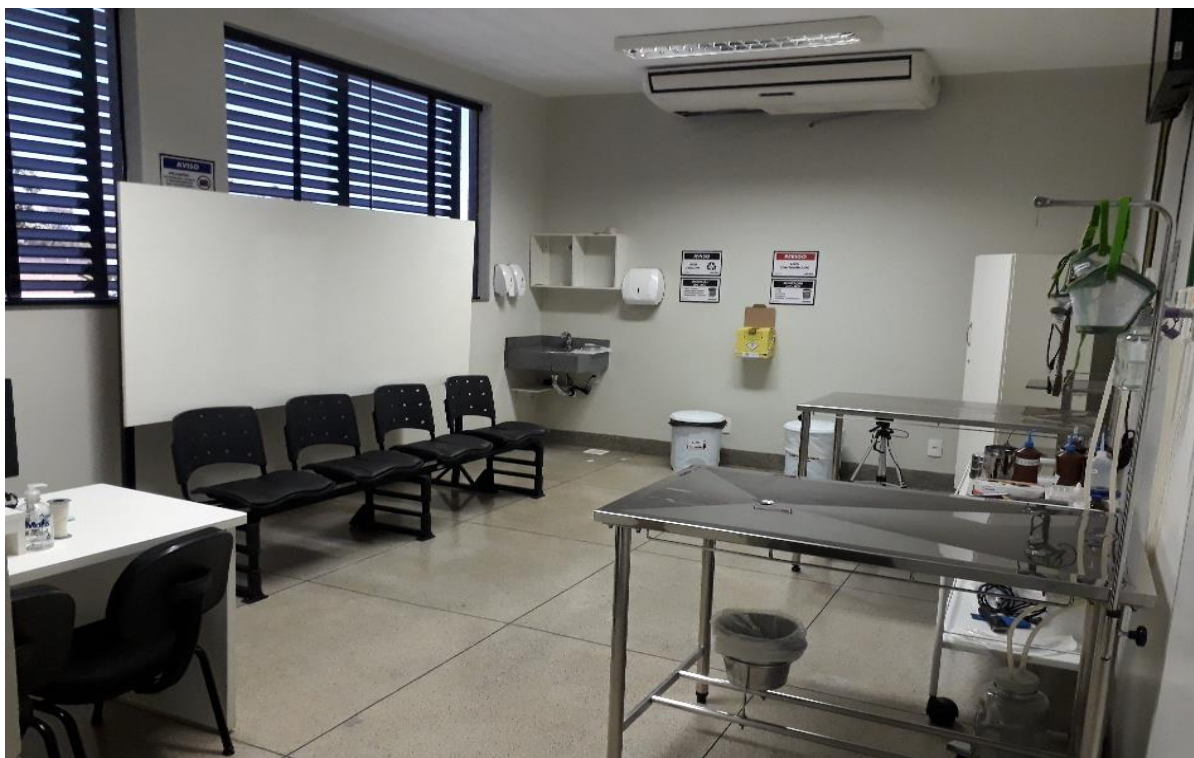
Figura 21. Consultório II do Hospital Veterinário – CEULP/ULBRA.