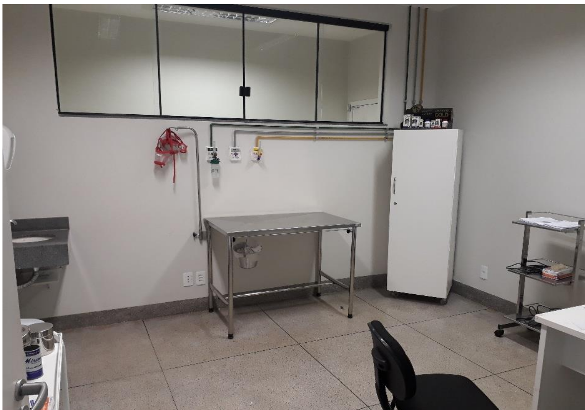
Figura 20 Consultório I do Hospital Veterinário – CEULP/ULBRA.