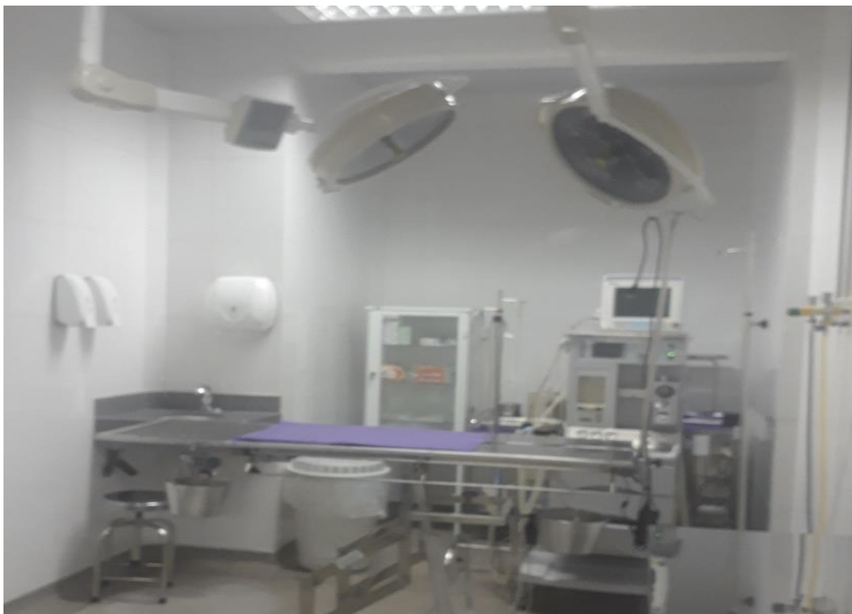
Figura 30. Centro Cirúrgico II do Hospital Veterinário – CEULP/ULBRA.