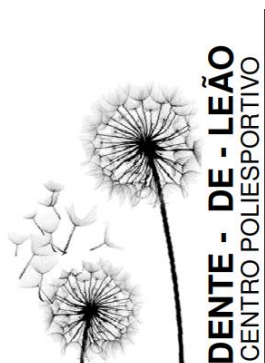
Figura 3 - Logomarca

O centro poliesportivo foi batizado de dente-de-leão pelo seu significado de liberdade, otimismo, esperança e luz. A flor está ligada aos sentimentos de felicidade de alegria de viver e por isso parece agregar ao caráter simbólico da proposta do centro de trazer liberdade e felicidade para os usuários.