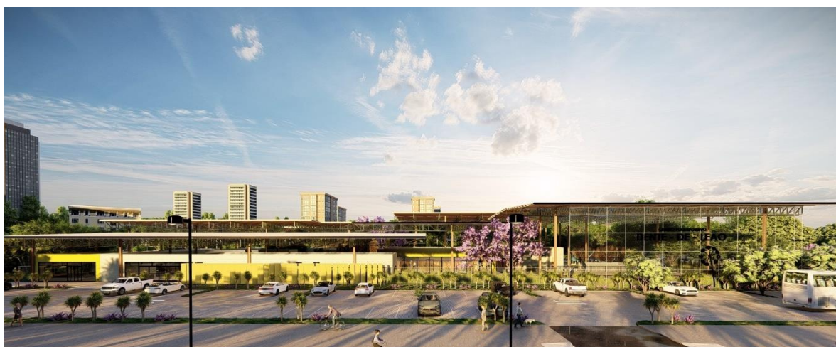
Figura 2 - Fachada Norte

Este complexo poliesportivo estende a proposta vinculada ao mês de setembro para o ano inteiro, influenciando diretamente na cura de sintomas psicológicos, amenizando transtornos de personalidade e contribuindo para a diminuição/extinção de suicídio, sabendo que o esporte e atividades físicas transformam vidas e mentes.